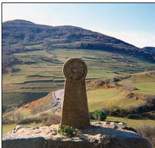
Monumento in memoria dei duecento catari bruciati durante l'assedio di Montségur (16 marzo 1244)